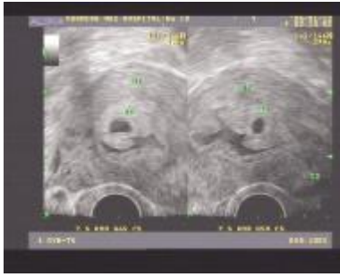
图1 先兆流产声像图