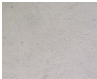
图 1 挽救成功的 hFFs

对照 hFFs 和经过挽救的 hFFs 的增殖能力均强, 倍增时间短, 生长曲线中 (图 2) 见一段时间内细胞数量与时间呈正相关。对照 hFFs 和经过挽救的 hFFs 的增殖能力均未见显著差异 ( P > 0.05 )。