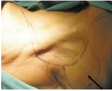
图 1 箭头为预画的斜方肌制备图，与颈清术距型切口相连，最后可一次性关闭伤口，无需植皮

Fig. 1 The arrows show the original drawing of incision of trapezius myocutaneous flap and rectangular incision of radical neck dissection, no need to make skin-grafting when suturing the incision