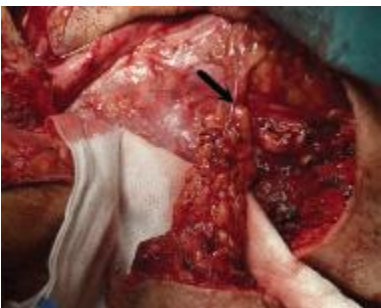
图 2 箭头所指为颈横动脉及刚制备好的斜方肌肌皮瓣

Fig. 1 The arrows show the original drawing of incision of trapezius myocutaneous flap and rectangular incision of radical neck dissection, no need to make skin-grafting when suturing the incision