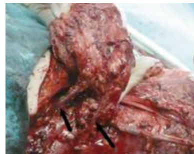
图 6 左箭头示皮瓣回流静脉，注入锁骨下静脉；右箭头示颈横动静脉。双静脉为皮瓣提供了高质量的血液回流通道

Fig. 5 The photo shows the whole floor of mouth, whole tongue, all lower tooth and part of mandible bone after resection