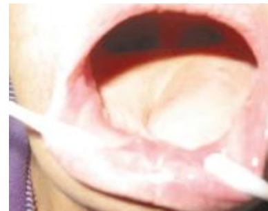
图 7 后复查，斜方肌皮瓣愈合良好，新口底及“舌”形成

Fig. 6 The arrow shows double venous return to guarantee trapezius myocutaneous flap more safer than average