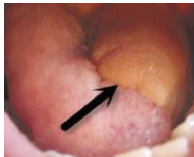
图 4 左半舌切除后用斜方肌肌皮瓣修复，术后 1 a

Fig. 3 The arrow shows the trapezius myocutaneous flap transferred to the floor of mouth, and the right mandible was partly removed