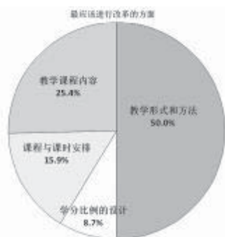
图 3 最应该进行改革的方面