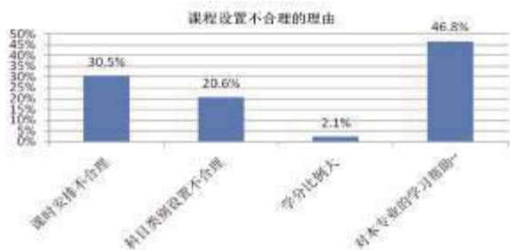
图 2 课程设置不合理的理由